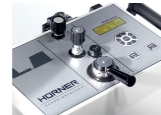
Frontfolie mit GT-Tastatur